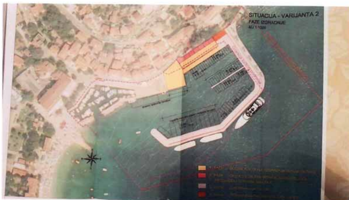
Dogradnja luke Mošćenička Draga