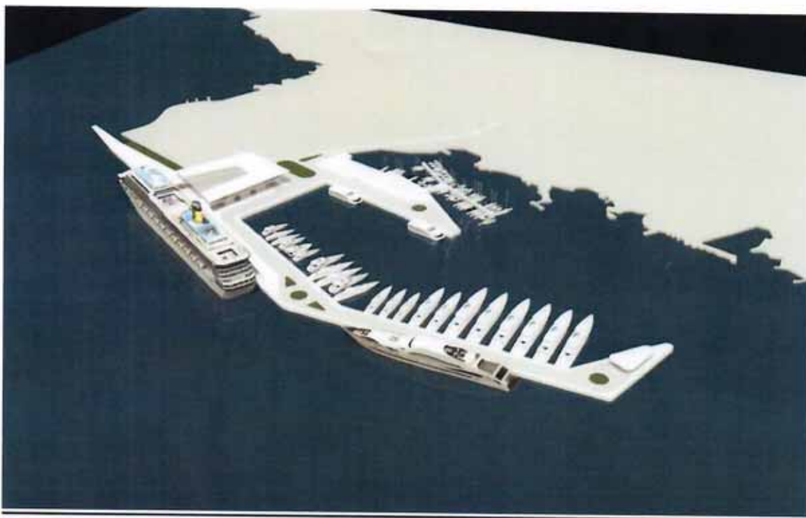
Dogradnja luke Opatija