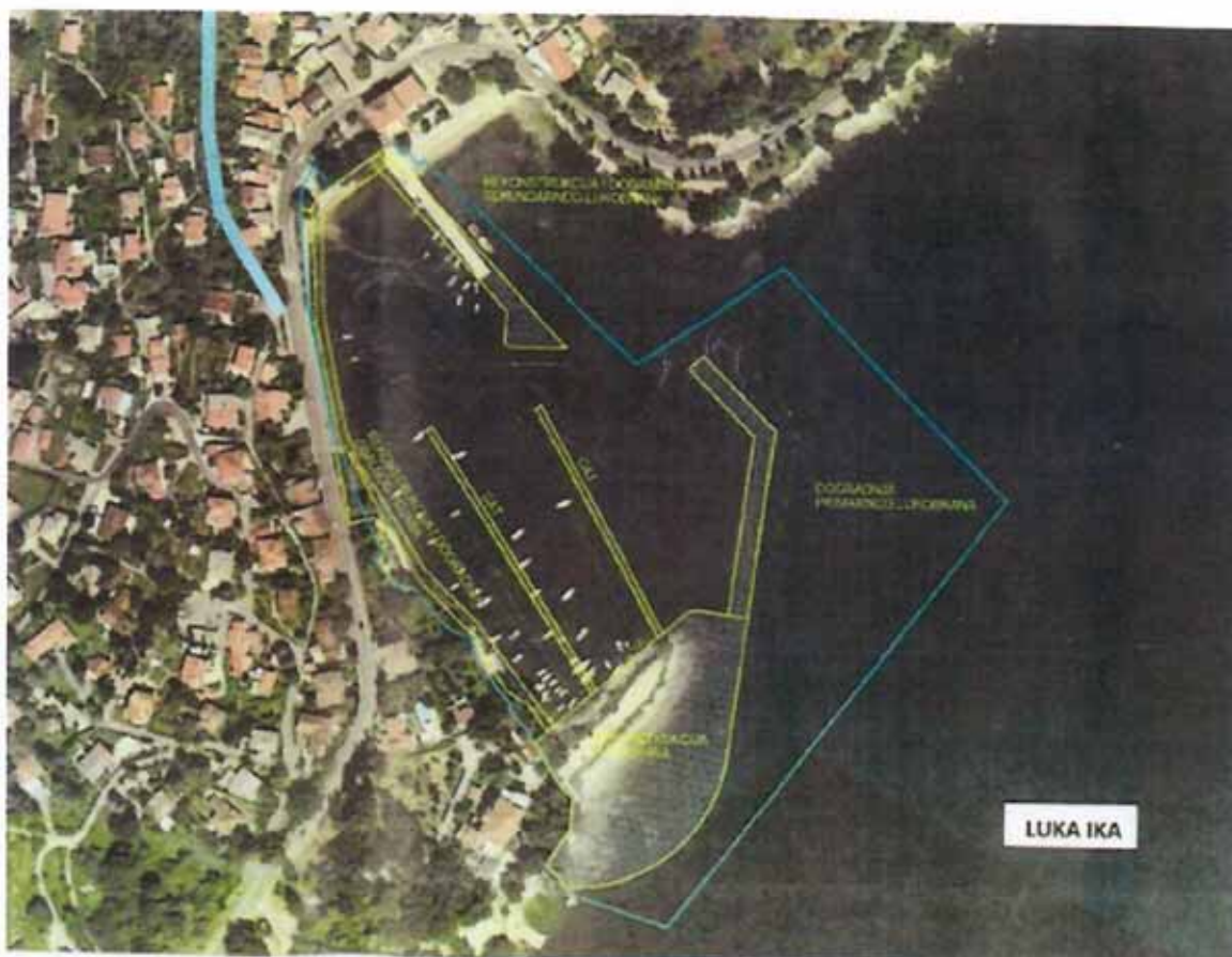
Dogradnja luke Ika.