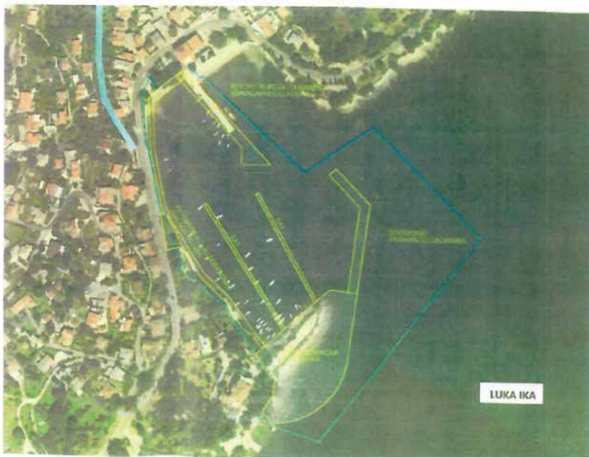
Dogradnja luke Ika.