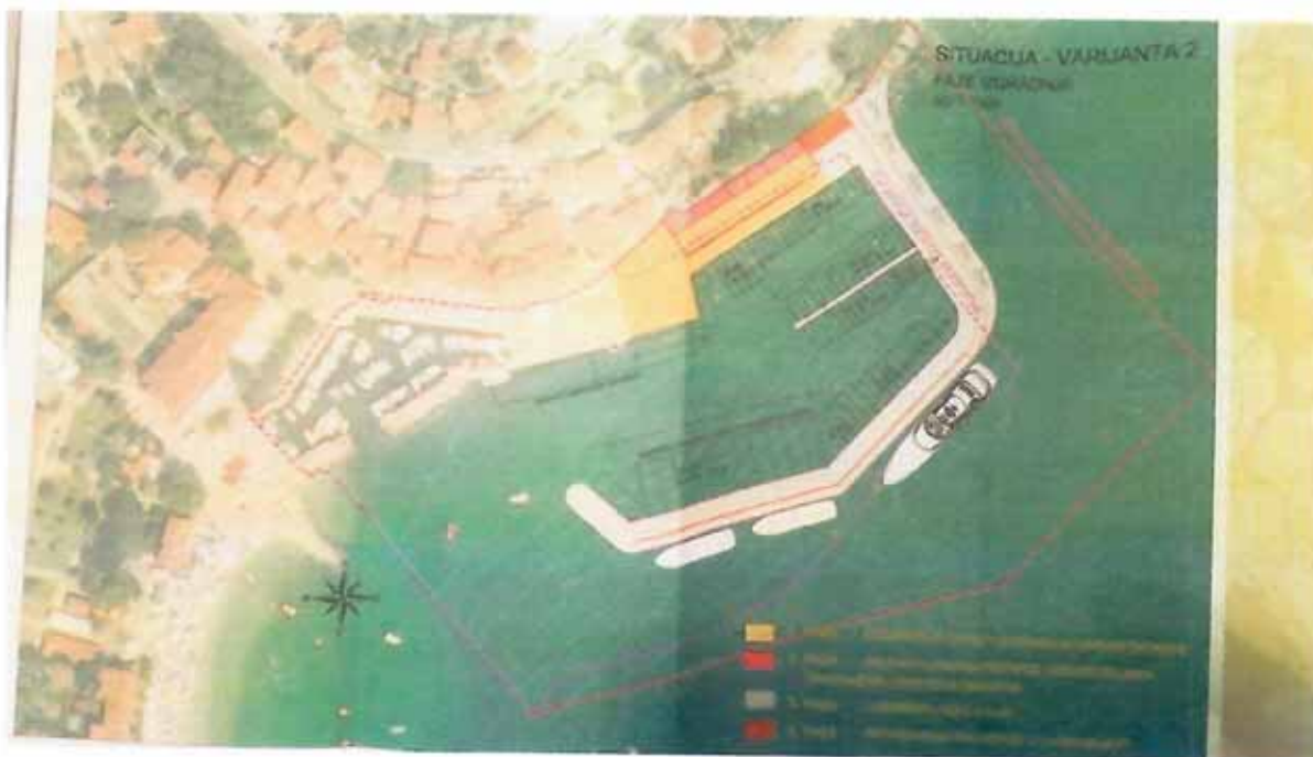
Dogradnja luke Mošćenička Draga