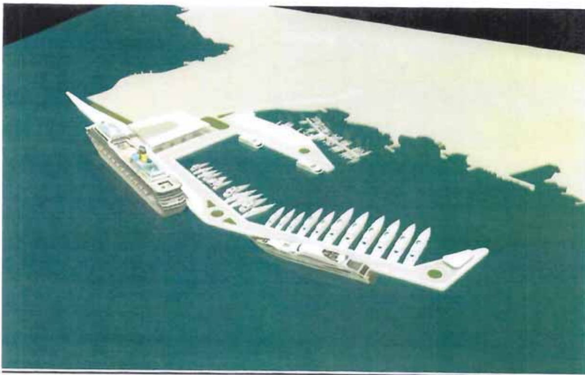
Dogradnja luke Opatija