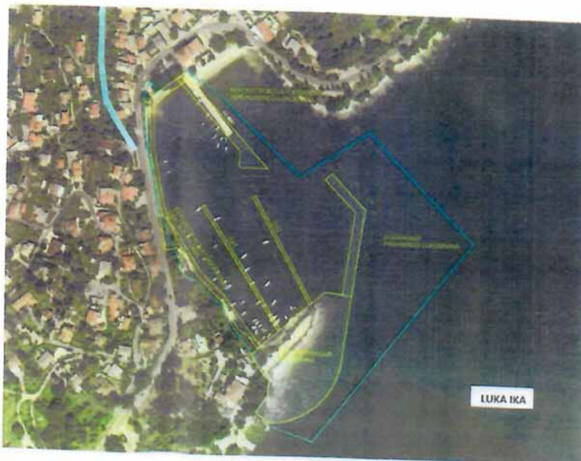
Dogradnja luke Ika.