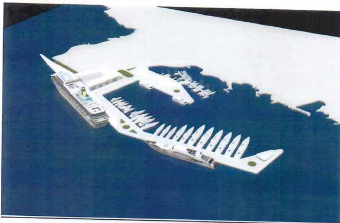
Dogradnja luke Opatija