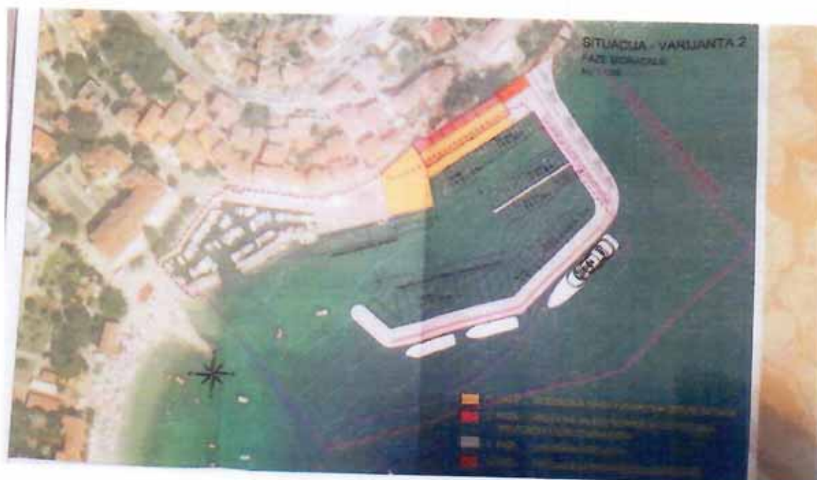
Dogradnja luke Mošćenička Draga